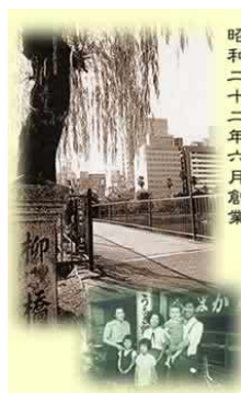
昭和二十二年六月創業